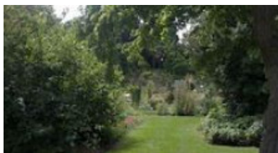
Jardin des Plantes