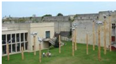
Musée des Beaux-Arts de Caen