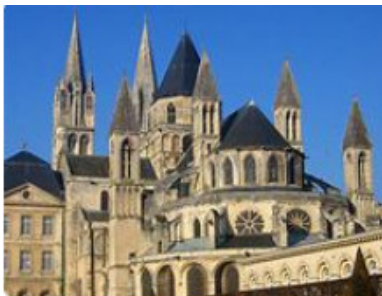
St-Étienne de Caen